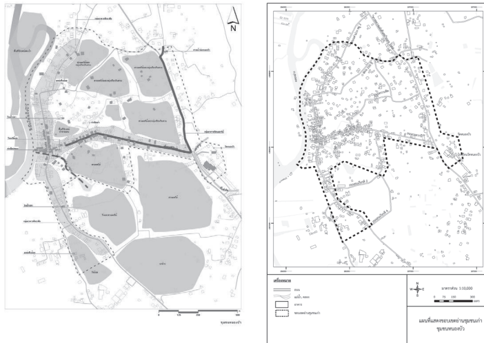
ภาพที่ 1 ตัวอย่างขอบเขตย่านชุมชนเก่าหนองบัว จ. จันทบุรี ที่ได้รับการประกาศเป็นมรดกจังหวัด

องค์ประกอบที่ไม่ใช่กายภาพ (Intangible Elements) ประกอบด้วย ลักษณะกิจกรรมในย่านชุมชนเก่า ลักษณะความหมายทางประวัติศาสตร์ การสืบปฏิบัติทางขนบประเพณี ความทรงจำ และ 3) ลักษณะของบริบทที่ตั้ง (Settings) โดยมีปัจจัยในการพิจารณาเพื่อระบุว่าชุมชนหนึ่งๆ เป็นย่านชุมชนเก่าหรือไม่ จากมาตรฐาน 3 ด้าน คือ 1) มาตรฐานคุณค่าความสำคัญและกายภาพของความเป็นย่านชุมชนเก่า 2) มาตรฐานด้านคุณภาพของย่านชุมชนเก่า และ 3) มาตรฐานด้านการบริหารจัดการของย่านชุมชนเก่า ซึ่งผลของการอาศัยเกณฑ์ข้างต้นสามารถนำมากำหนดขอบเขตย่านชุมชนเก่าได้แสดงดังตัวอย่างในภาพที่ 1