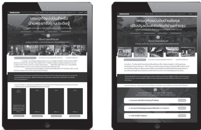
ภาพที่ 3 เครื่องมือการระดมทุนเพื่อการรักษามรดกวัฒนธรรมด้วยเทคโนโลยี

การขับเคลื่อนในระยะที่สองได้สนับสนุนในรูปแบบการสร้างข้อตกลงร่วมในการอนุรักษ์ (Dialogue Process in Conservation) ดำเนินการด้วยแพลตฟอร์มรดกภายใต้โครงการปรับปรุงบ้านซัยกุลเป็นพิพิธภัณฑ์บ้านเก่าขลุง โดยบ้านซัยกุลเป็นบ้านคหบดีตระกูลซัยกุลที่มีบทบาทในการพัฒนาเศรษฐกิจ-การค้าของเมืองขลุง จังหวัดจันทบุรี ตัวอาคารมีอายุกว่า 140 ปี เป็นอาคารสองชั้น รูปแบบสถาปัตยกรรมครึ่งปูนครึ่งไม้ ปัจจุบันอาคารมีสภาพทรุดโทรมทำให้ลูกหลานในตระกูลมีแนวคิดในการบูรณะฟื้นฟูบ้านหลังนี้เพื่อเป็นพิพิธภัณฑ์ชุมชนเมืองเก่าขลุง เป็นแหล่งเรียนรู้ด้านมรดกวัฒนธรรม และสร้างกิจกรรม บรรยากาศการอนุรักษ์ชุมชนเก่าตลาดขลุง วัตถุประสงค์ของโครงการมีเพื่อสร้างแพลตฟอร์มในกระบวนการกำหนดกิจกรรม รูปแบบการปรับปรุง และโปรแกรมการใช้สอยภายในอาคาร ด้วยกระบวนการมีส่วนร่วมแบบครอบคลุม (Inclusive Design) ร่วมกันของคนในเมือง เพื่อให้อาคารเปรียบเสมือนห้องรับแขกเมือง ที่ให้ข้อมูลประวัติศาสตร์ ความน่าสนใจเกี่ยวกับเมือง และสร้างกระบวนการสาธารณะในพื้นที่ ร่วมกับชุมชน หน่วยงานท้องถิ่น และสถาบันการศึกษาในจังหวัด