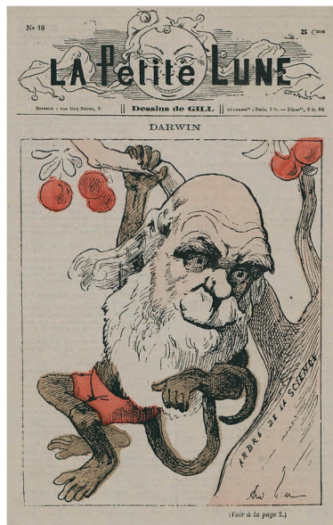
Front page of the French satirical magazine La Petite Lune by André Gill