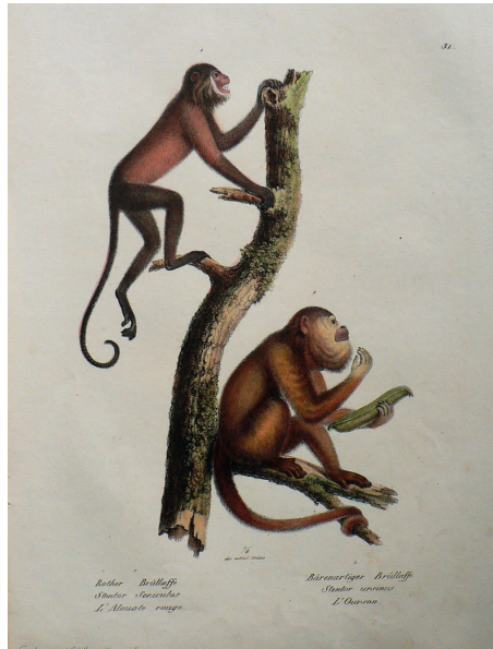
ภาพจากหนังสือ Naturhistorische Abbildungen der Säugethiere (Natural History of Mammals) (1824) วาดภาพโดย Heinrich Rudolf Schinz