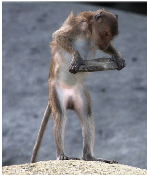
ลิงแสม ( Macaca fascicularis)