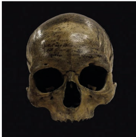
กะโหลกของ เรอเน่ เดส์คาร์ต (René Descartes)