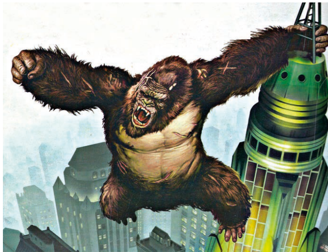
โปสเตอร์ภาพยนตร์ King Kong