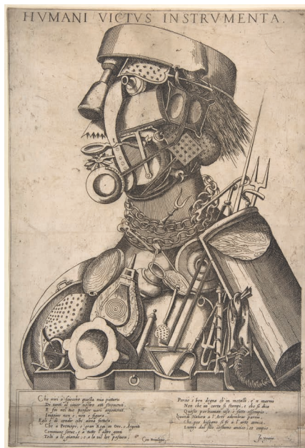
Giuseppe Arcimboldo- The Instruments of Human Sustenance (Humani Victus Instrumenta) : Cooking