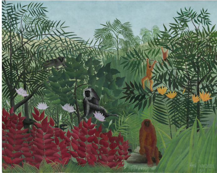
Henri Rousseau - Tropical Forest with Monkeys