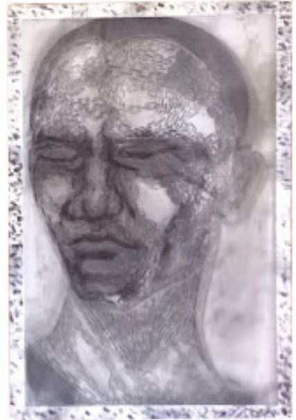
วีระพล สุวรรณวงศ์, 2561, สัญญาแห่งการจองจำในความทรงจำ, จิตรกรรมเทคนิคผสม, 120x80 ซม.