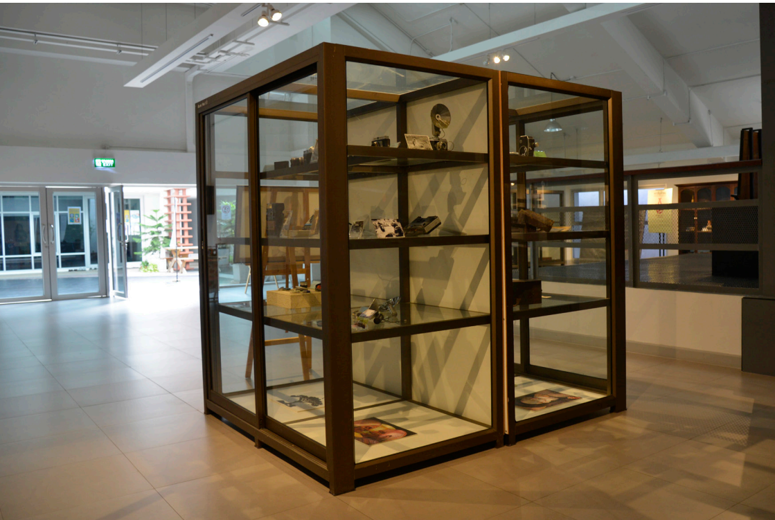
ธานี บุญรอดเจริญ, 2562, ดินแดนโดดเดี่ยว, วัตถุจัดวาง ขนาดแปรผันตามพื้นที่