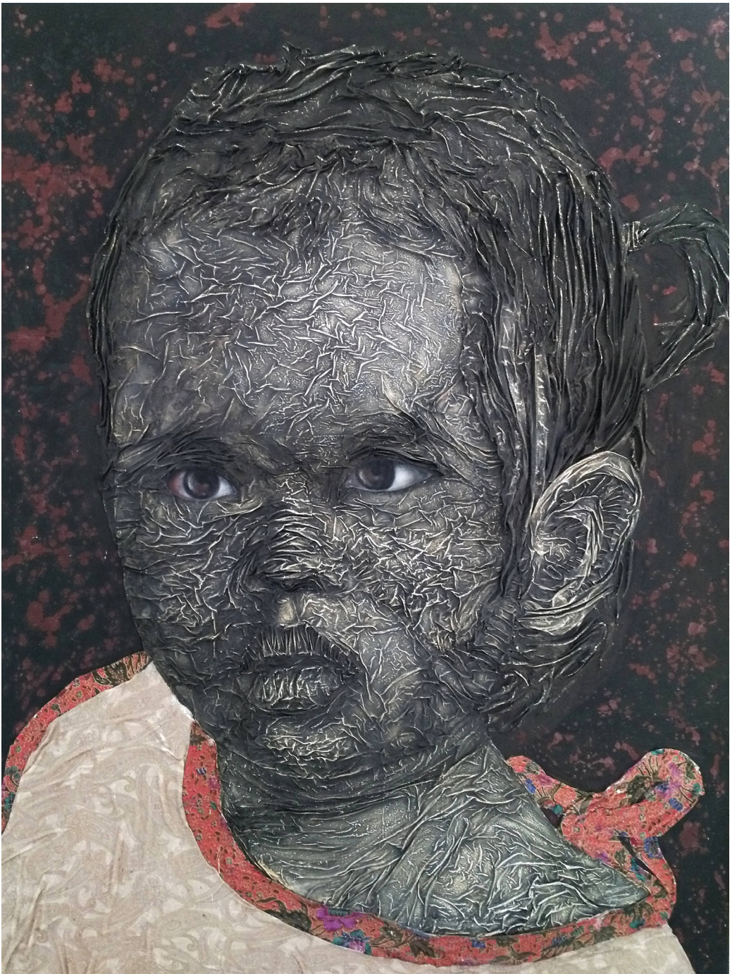
สาเหอุสมาน เศษดอเ้าะ, 2560, ความทุกข์ของชาวบ้าน หมายเลข 2, จิตรกรรมวัสดุผสม