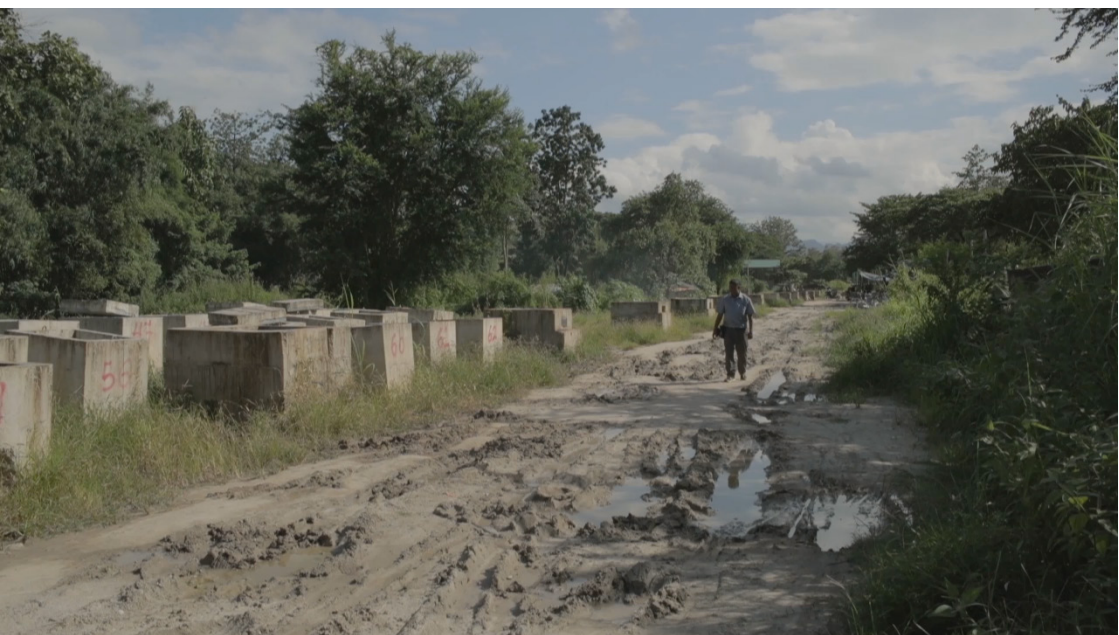
ณณฐ ชนพรรพี, 2561, No Man's Land , วิดีโอ 20:22 นาที